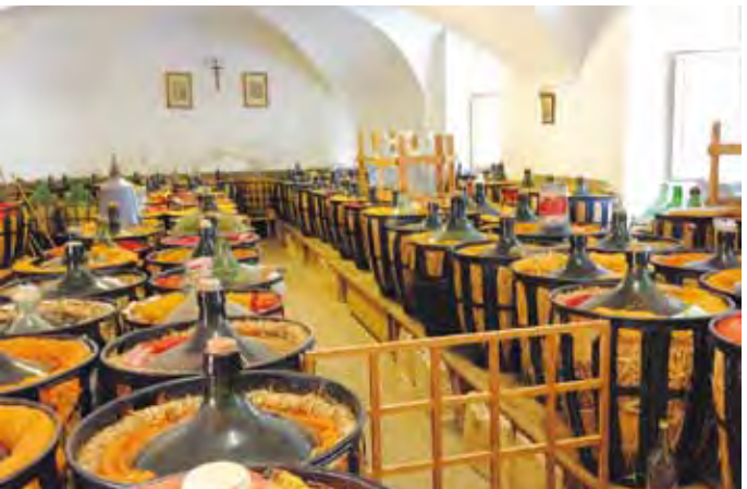
In den Gewölben des Klosters lagern Köstlichkeiten aus eigener Produktion...