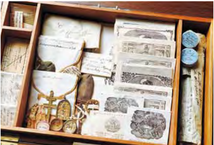
Viele Einblicke ins klösterliche Leben bietet die Beuerberger Ausstellung.

Darüber hinaus wird die diesjährige Sonderausstellung ganz im Zeichen des 350-jährigen Gründungsjubiläums des Münchner Salesianerinnenklosters stehen. Aus diesem Anlass werden ver-