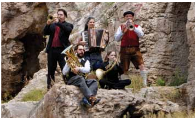
Türkeireise: Die Unterbiberger Hofmusik in der Höhlenstadt von Sanliurfa.