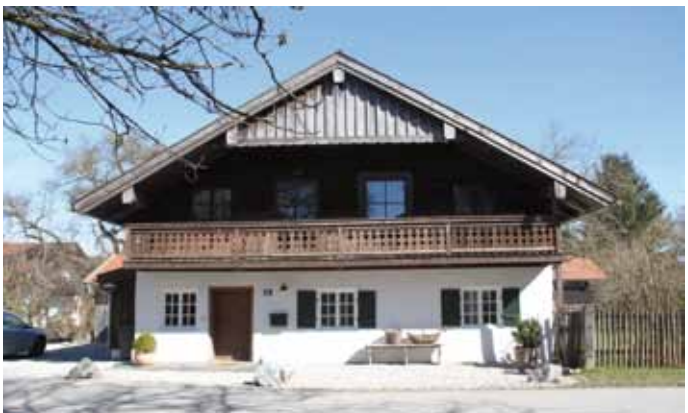
...mit altem Hof ein Ensemble in Weipertshausen.