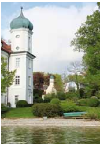
Poccischloß vom Wasser aus.

Wir glauben, mit der Einteilung in die sechs Themenbereiche und der vorliegenden Auswahl einen Anstoß geben zu können, zum genauen Hinsehen, zum Lernen aus dem Detail, zum Verständnis für Architektur in