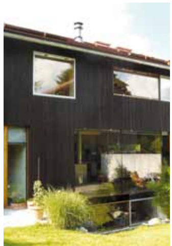
Moderne Häusergruppe bildet...

stellung in den siebziger Jahren an der Technischen Universität München mit dem Namen: „Neues Bauen in alter Umgebung“, die durchaus Vorbild für die jetzige Ausstellung war. Immer geht es dabei um kulturhistorisch interessante Orte, deren Bausubstanz besonders schützenswert ist und wo, wie überall, auch Neues hinzukommen muss. Wie kann dieses spannende Thema – die Verknüpfung von Alt und Neu – bestmöglich gelöst werden? Das Ausstellungsteam des Wessobrunner Kreises hat dafür folgende Kriterien festgesetzt: