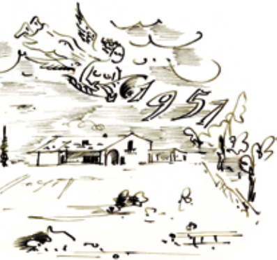
Skizze von Rupprecht Geiger