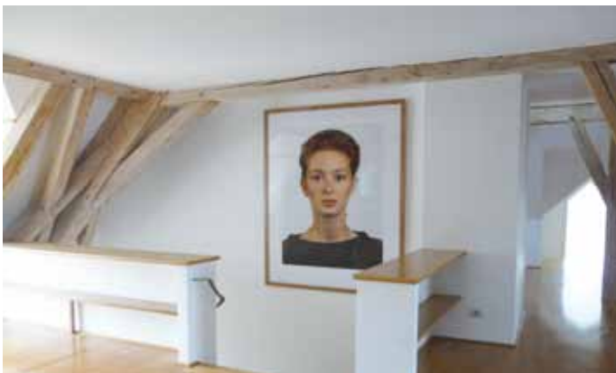
Dachausbau in altem Gemäuer.

Weitere Infos unter www.wessobrunner-kreis.de