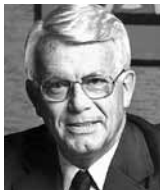
Lothar-G. Buchheim Henri Nannen

dort Kunst. Im Zweiten Weltkrieg war Nannen Kriegsberichterstat-ter bei der Luftwaffe, während Buchheim in selber Funktion auf und unter dem Wasser bei der Marine unterwegs war. Nach dem Krieg wurden beide berühmt, der eine als Gründer, Chefredakteur und Herausgeber des „Stern“, der andere wegen seiner Kunstkauder und Bücher, vor allem durch den Weltbestsel-ler „Das Boot“.