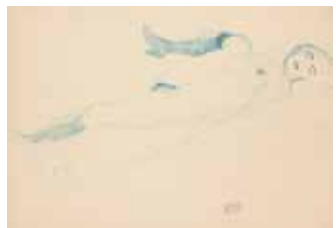
Gustav Klimt, Liegender Akt, 1912/1913

Rodin begründete eine künst- leriische Auffassung des weib- lichen Akts, die in der klassi- schen Moderne des frühen 20. Jahrhunderts bestimmend wird: Die Künstler wollten in ei- ner von Stilisierung und Ideali- sierung befreiten Darstellung zu einer unmittelbaren, natürlichen Erotik vordringen. Gustav Klimt begegnete Rodin 1902 in Wien und ließ sich von dessen Ansatz inspirieren. Auch die Brücke- Künstler nahmen diesen Impuls