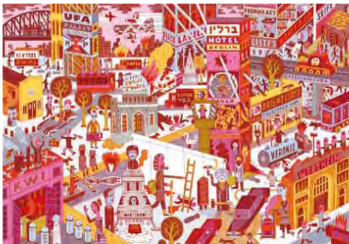
Chart „Berlin“, 2010