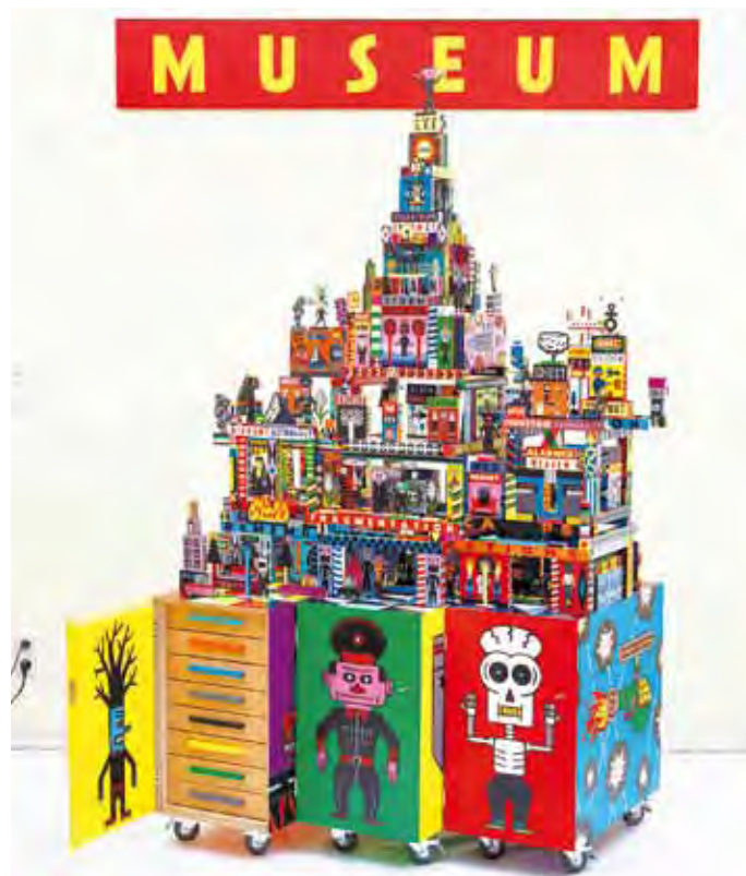
Automatisches Illustrationssystem »tobot«, 2006-2013